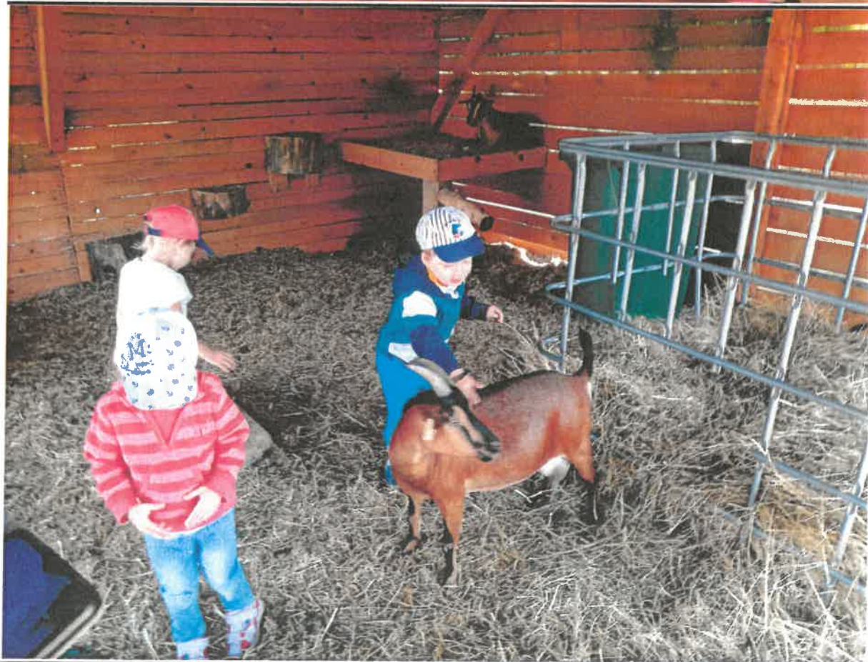
VÝLET NA FARMU LITTLE FARMERS V RYCHNOVĚ U JABLONCE NAD NISOU